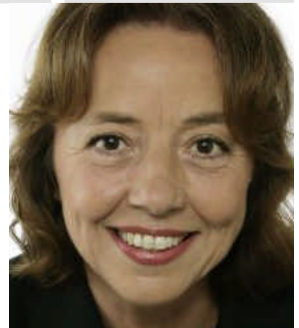
Mitglied Auswärtiger Ausschuss

Selbstverständlich muss Wasser aber auch ohne wenn und aber als fundamentales Menschenrecht anerkannt werden. Denn ohne Wasser gibt es kein Leben. Obwohl ein Mensch an Durst bekanntlich sehr viel schneller stirbt als an Hunger, ist das Recht auf Wasser noch kein eigenständiges Recht und steht auf schwächeren Füßen als das Recht, sich zu ernähren. Die verbrieften Menschenrechte auf Gesundheit und einen angemessenen Lebensstandard ergeben wenig Sinn, wenn wir nicht dem Recht auf Wasser besser zur Geltung verhelfen. Nachdem man sich jahrzehntelang darüber stritt, ob Wasser eher Grundbedürfnis oder Menschenrecht ist, war die Veröffentlichung eines Rechtskommentars im Jahr 2002 ein echter Fortschritt. Dieser leitet das Recht auf Wasser juristisch aus dem Recht auf einen adäquaten Lebensstandard, auf Nahrung und auf Gesundheit her. Diese sind Teil der wirtschaftlichen, sozialen und kulturellen Menschenrechte („WSK-Rechte“), auf die sich die internationale Gemeinschaft 1966 einigte.