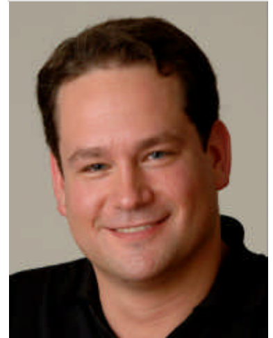
Mitglied Haushalts- und Verteidigungsausschuss

Die CDU versucht nun, Schilys alte Vorschläge ständig durch spektakulärere Maßnahmen zu überbieten, während die SPD höchstens halbherzig protestiert. Die Union stößt regelmäßig an die Grenzen sowohl der Verfassung als auch der Absurdität. Wenn der Bundesinnenminister, dem Kraft des Amtes auch der Schutz der Verfassung obliegt, mit seinen Maßnahmen im Namen der Sicherheit regelmäßig gegen Gesetze und Verfassung verstoßen würde, ist das mehr als bedenklich. Unerträglich wird es, wenn im Zweifel Gesetze und Verfassung angepasst werden sollen. Alles soll sich dem Primat der Sicherheit unterordnen. Der „Krieg gegen den Terrorismus“ scheint nach Logik des Innenministers auch eine Art „Kriegsrecht“ in der Innenpolitik zu erfordern. In Interviews betonen konservative Politiker regelmäßig, dass der demokratische Rechtsstaat gegen den Terrorismus hilflos sei und sich ändern müsse.