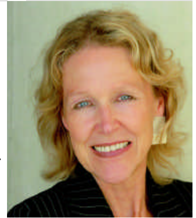
Mitglied Ausschuss für Umwelt, Naturschutz und Reaktorsicherheit

Aus Umweltsicht ist heute ein neuer Ansatz nötig: Die Umwandlung der Abfallwirtschaft in