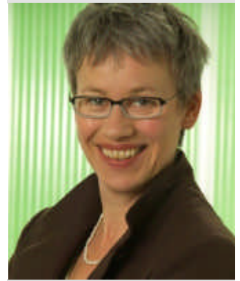
Mitglied Ausschuss für Gesundheit und Soziales

würdig gestaltet wird. Gesundheit gehört aber nicht dem Gesundheits- wesen allein. Sie ent- steht dort, wo Familien leben, Kinder spielen oder Menschen arbei- ten.