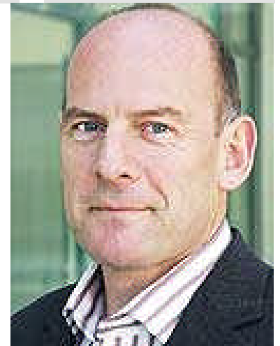
Mitglied Sport- und Verkehrsausschuss

Mit den rot-grünen Vorgaben im Bundesimmissionschutzgesetz von 2002 und der dazugehörigen Verordnung (22. BImSchV) wurde den Kommunen eine Vielzahl von Instrumenten zur Verfügung gestellt, mit denen sie gegen die Emissionsquellen vorgehen können z.B. Fahrbeschränkungen und Verbote, Stilllegung von Industrieanlagen) grundsätzlich nur erteilt werden, wenn die Grenzwerte in der Nähe der Nach den Luftreinhaltvorgaben sind die zuständigen Behörden der Länder in Zusammenarbeit mit den Gemeinden in der Pflicht Luftreinhalt- und Aktionspläne zu erstellen und auch zu realisieren. In Baden-Württemberg ist das Regierungspräsidium koordinierend, doch auch Bürgermeister von Gemeinden sind dafür verantwortlich, dass in kommunalen Gremien abgestimmte Maßnahmenpläne auch in die Tat umgesetzt werden. Die Bürger erhielten Kraft Gesetz 2002 schon das Recht die Einhaltung der Immissionsgrenzwerte einzuklagen. Damals hatte der Umweltausschuss des Bundesrates der 22. BImSchV zugestimmt. Doch schon mit Näherrücken des Termins und erst Recht aufgrund der Feinstaubmessungen vor 2005 ändert sich die Haltung in vielen Ländern und