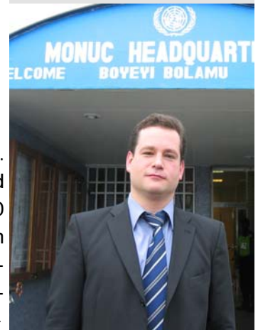
Vor dem UNO Hauptquartier in Kinshasa

Zudem geht es der Regierung offenkundig auch nicht um das Ergebnis der Mission, sondern dar-