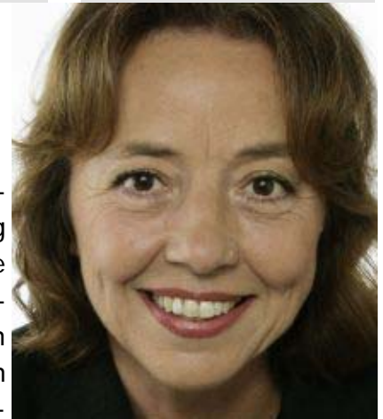
Mitglied im Auswärtigen Ausschuss

Bedeutung. Sie sind notwendiger Schritt und zugleich Risikofaktor. Es geht darum, den noch fragilen Friedensprozess unter Führung einer demokratisch gewählten Regierung fortzuführen und ihn unumkehrbar zu machen. Und es geht darum, die Wahl abzusichern, d.h. Aufstände und Rebellionen von Wahlverlierern zu verhindern und mögliche Unruhestifter durch erhöhte Präsenz abzuschrecken. Dem kriegstraumatisierten Land und seinen 55 Millionen Einwohnern bietet sich mit den Wahlen eine realistische Chance, den Weg in Richtung Demokratie und Frieden weiter zu gehen. Dass sie diesen Weg trotz aller Widrigkeiten im Friedensprozess beschreiten will, hat die kongolische Bevölkerung bereits im vergangenen Jahr mit einem beeindruckenden Verfassungsreferendum, an dem 60% der Wahlberechtigten teilnahmen, gezeigt. Nun können sich die Kongolesen erstmals nach 40 Jahren aktiv am politischen Prozess beteiligen und ihre Erwartungen an die Wahlen sind hoch. Sie müssen ermutigt und gestärkt werden – auch darin besteht eine der Kernaufgaben der "Wahlsicherung". Dass nämlich ihre Stimme zählt und das Wahlergebnis nicht gewaltsam in Frage gestellt wird, auch dafür steht die erhöhte Präsenz internationaler Truppen, für die sich im übrigen auch die unabhängige kongolische Wahlkommission ausgesprochen hat.